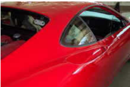
Alukarosserie (Lackbesch. vom Hagel)

Bei schon beschädigtem Lack, anstatt geschweißter Karosserieteile zu erneuern. Dabei ist ein anschließender Spachtelauftrag nicht mehr notwendig.