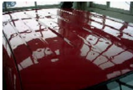
Sehr große und viele Dellen (ca. 300)