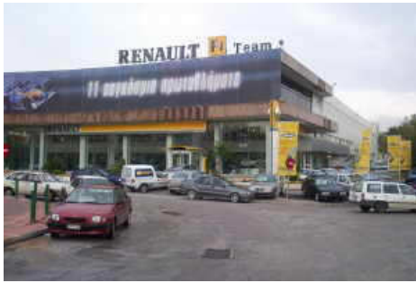
Renault in Griechenland