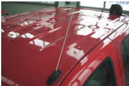
Stark beschädigtes Dach (ca. 300 große Dellen)

Karosserieteile mit sehr großen Dellen (bei denen der Lack vom Hagelschlag schon beschädigt wurde), oder einer zu großen Dellenanzahl am Bauteil, richten wir zum Lackieren vor. Dies ist sinnvoll bei geschweißten Teilen wie zB. Dächer und Seitenwände, anstatt diese mit großem Aufwand erneuern zu müssen.