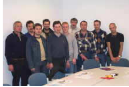
Kurs bei Lack und Technik in Linz

Wir veranstalten aber auch Tagesseminare für Personen die immer wieder mit Hagelschäden und Dellen zu tun haben, wie zB. Sachverständige oder Kundendienst Personal von Autohäusern.