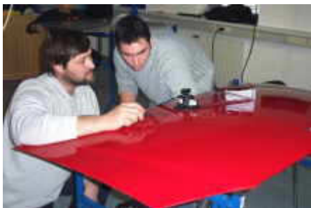
Erklären der Vorgehensweise

In den von uns abgehaltenen speziellen Kursen erhalten Sie das erforderliche Know-how und erlernen Schritt für Schritt diese neue Technik. Diese Kurse werden sehr praxisnah, mit möglichst wenig Theorie, aber mit sehr viel Übung am Teil angeboten. Zum Abschluss des Kurses erhält jeder Teilnehmer ein Zertifikat.