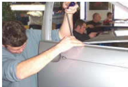
Übung bei einer Tür

Bei unseren Kursen werden Sie oder Ihre Mitarbeiter von Ausbeulprofis geschult, die das ganze Jahr über ausschließlich mit dieser Technik arbeiten. Dies lässt sehr viel vom Reparaturalltag in unsere Kurse einfließen, wovon wiederum Sie profitieren.