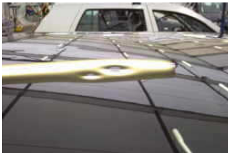
Spiegelung einer Delle

Die Delle wird von der Unterseite des Bleches her mit den Spezialwerkzeugen bearbeitet und gewissermaßen punktuell herausmassiert. Anhand der Reflektion der Speziallampe auf der Oberseite des Bleches lässt sich genau feststellen, an welchem Punkt das Werkzeug angesetzt wird.