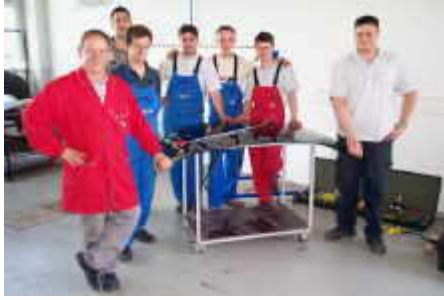
Geschlossene Schulung beim Importeur