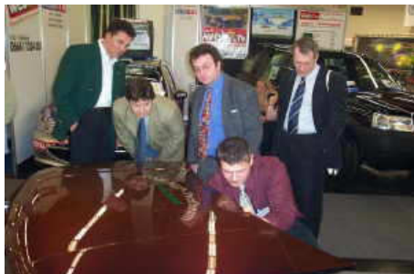
Auto Zum in Salzburg

Als Marktführer in Österreich sind wir natürlich auch Aussteller auf Fachmessen, wie der „Auto- Zum“ in Salzburg, oder einer „Automechanika“ in Frankfurt. Ebenso wichtig sind uns aber auch Hausmessen oder ein Tag der offenen Tür von Werkstätten, bei denen wir gerne bereit sind, den Kunden des Hauses diese Ausbeultechnik zu präsentieren.