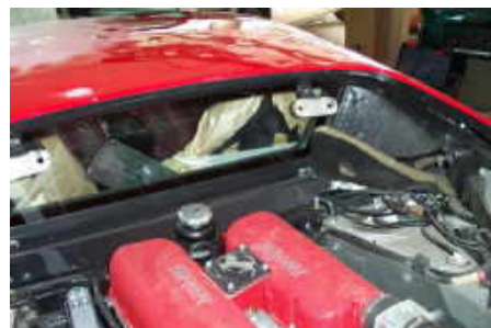
Ferrari Alukarosserie (Lackbeschädigung vom Hagel)

Bei dieser Reparatur wird das Blech wie anfangs beschrieben, in seine ursprüngliche Form gebracht. Diese Variante ist natürlich kostengünstiger, da dabei schneller gearbeitet werden kann, weil anschließend lackiert wird und so ganz kleine Unebenheiten nicht stören. Großflächig ist aber das betreffende Karosserieteil vollkommen in Ordnung, sodass ein Spachtelauftrag entfällt, es muss nur mehr ein Füller aufgetragen und lackiert werden.