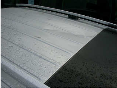
Beschädigung durch Dachlawine)

Kollisions- u. Vandalismusschäden, Verformungen von Dachlawinen.