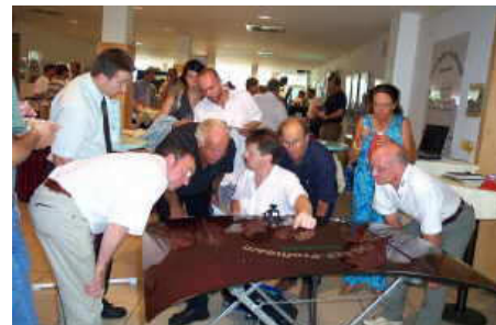
Jahrestreffen einer Werkstättenkette