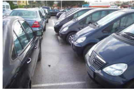
Mercedes Benz Importeur

Die Importeure von BMW, Toyota, Renault -Nissan, Honda und die Porsche Organisation in Österreich gehören genauso zu unseren Kunden, wie Porsche Slowenien oder der Importeur von Mercedes Benz in Griechenland. Weiter dürfen wir viele Autohäuser und Werkstätten im In- und Ausland betreuen. Wir arbeiten aber auch für große LAKAZE (Lack- u. Karosseriezentrum), größere und kleinere Autolackierereien und Spenglereien sowie für Autotransporteure.