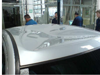
Stark beschädigt durch Dachlawine (Lackbeschädigung)