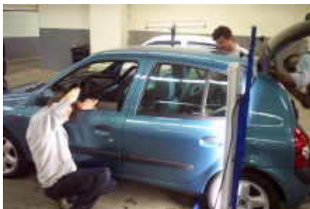
Tiefgarage in Griechenland