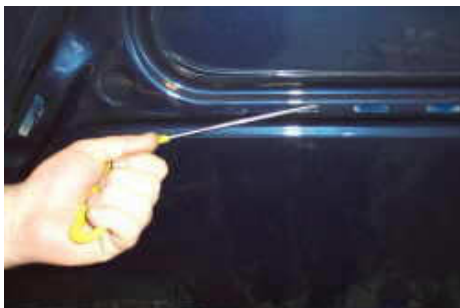
Zugangsmöglichkeit bei einer Strebe

Ist auch dies nicht möglich, lassen sich einzelne Dellen von außen bearbeiten. Dabei wird mit einem speziellen Heißkleber ein kleiner Kunststoffadapter auf den Lack geklebt, um anschließend die betroffene Delle mit einem Spezialwerkzeug herausziehen zu können. Im Anschluss wird der Kleber mit einem Spezialentferner vom Lack gelöst und eventuelle Stellen, die zu hoch sind, mit einem Nylonstift zurückverformt.